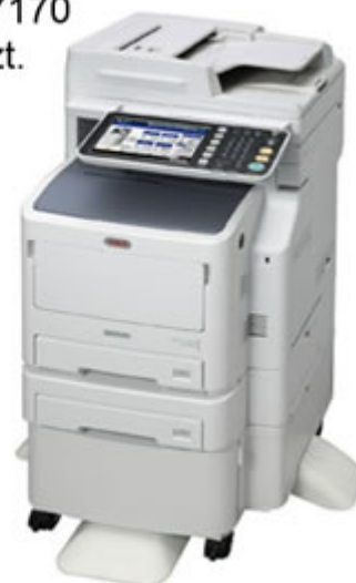
OKI ES 7170 128 szt.

Postępy w realizacji projektu można śledzić na internetowej stronie śląskiej policji, w zakładce Policja Śląska > Fundusze Pomocowe > Cyfrowe Obserwatorium Bezpieczeństwa Województwa Śląskiego - Śląska Policji bliżej społeczeństwa.