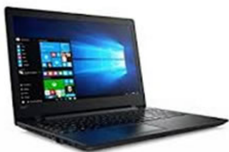
LENOVO L470 1120 szt.