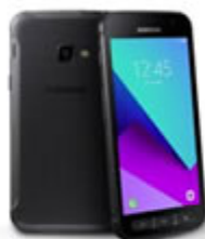
SAMSUNG GALAXY XCOVER 4 - 1120 szt.