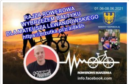
Plakat wyprawy Rajza Rowerowa Wybrzeżem Bałtyku