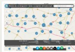
Historia Zdarzeń Drogowych i Miejsc Szczeg. Niebezp.