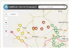
Zdarzenia Drogowe On-line