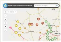
Zdarzenia Drogowe On-line