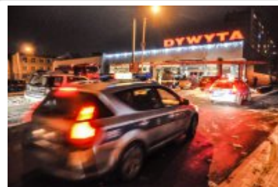
Nasz Racibórz zdjęcie