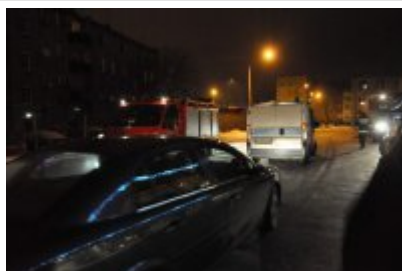
Nasz Racibórz zdjęcie